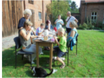
Nach dem Schulbeginngottesdienst in Pinnow.